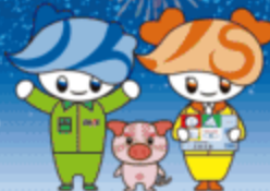
オーくん ホクブー エスちゃん