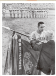
昭和47年度の中野高木大で優勝した大分県立高校(大分県立歴史博物館蔵)