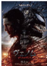
©.TM. 2024 MARVEL. ©2024 CFI. All Rights Reserved.

制限事項 ●インターネットや発券機で先に購入していた場合、座席割りはできません。 ●本券は1回の映画鑑賞につき1枚のみ使用いただけます。 ●特別先行作品には使用できません。●本券は1枚につき1名様のみ使用いただけます。 ●以外の映画館では使用できません。