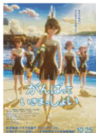
かんばんでいっしょに遊ぼう 製作委員会