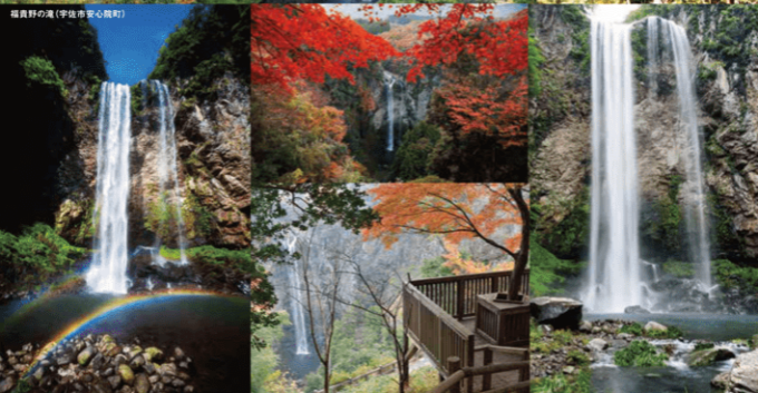
福貴野の滝（宇佐市安心院町）