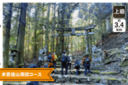
求菩提山周回コース