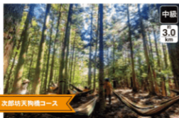
次郎坊天狗橋コース