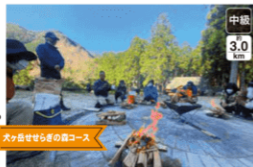
犬ヶ岳せせらぎの森コース

参加費 一般料金 ¥3,500円 会員 ¥2,500 (昼食・保険・体験料等含む)