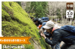
犬ヶ岳せせらぎの森コース