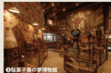
③駄菓子屋の夢博物館

チャイムの音が聴こえてきそうな教室や駄菓子屋・写真館など、昭和30年代の風景が広がっています。