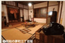
②昭和の夢町三丁目館