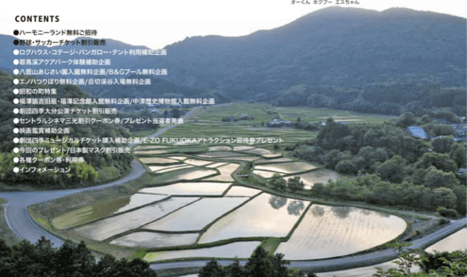
田楽荘小崎(重要な文化的景観:豊後高田市)