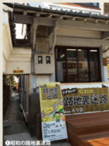
①昭和の路地裏迷路

全長180mの巨大迷路で、昭和時代にタイムスリップ。深くドア開かないドアなど、仕掛けがいっぱい。