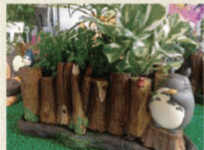
グリーンショップ あいびー

中津市大員298-1 ☎0979-26-0785 【営】9:00～18:30【休】日曜日