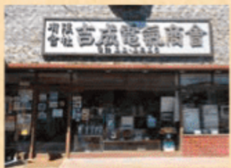
⑬吉成電気商会 豊後高田市中央通698 ☎0978-22-2320 [営]8:00～18:30 [休]不定休