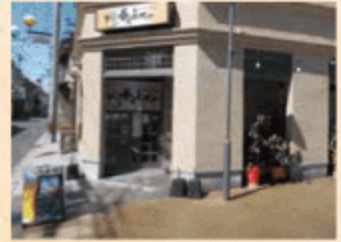
⑨ Okiraku Dining 呑もうっちゃ 豊後高田市新町966-2 ☎0978-25-9119 [営]11:30～ [休]不定休