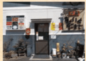
⑮串焼 ちよいとそこまで 豊後高田市宮町2861-1 ☎0978-24-0603 [営]17:00～23:00 [休]日曜日 / 祝日の月曜日