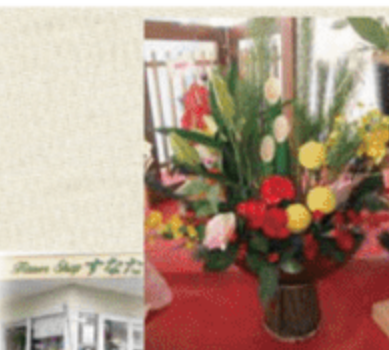
フラワーショップ すなた

宇佐市上田1007-15 ☎0978-32-4080 【営】9:00～19:00 【休】1/1～1/3・8/15・8/16