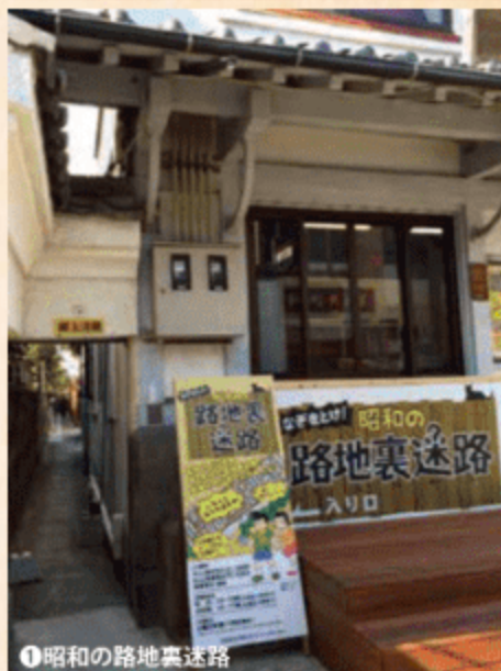
①昭和の路地裏迷路

休館日・営業時間は予告なく変更になることがあります。必ず事前にご確認のうえご利用ください。