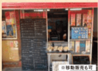
⑤café空 豊後高田市新町992-16 ☎080-3282-9627 [営]未定 [休]未定