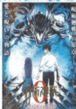
© 2021 劇場版 呪術廻戦 0 製作委員会 の芥下下々/集英社