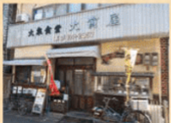
④大賀屋食堂 豊後高田市新町992 ☎0978-24-2357 [営]10:30～15:00(499切れ) [休]火曜日

利用方法 会員証提示のうえ、14Pのクーポン券に、必要事項を記入し、お会計時にお渡しください。 下記の(4)～(12) お買上げ500円以上限り 指定店舗で 500円引 となります。 ※会員証・クーポン券(14P)のどちらかを お忘れの場合は利用できません。 ※クーポン券は1会員1回限り(1枚のみ)利用できます。各2回以上利用していた場合は後日返金していただきます。 ※店舗休日、営業時間は予告なく変更することがあります。お確かめのうえお出かけください。