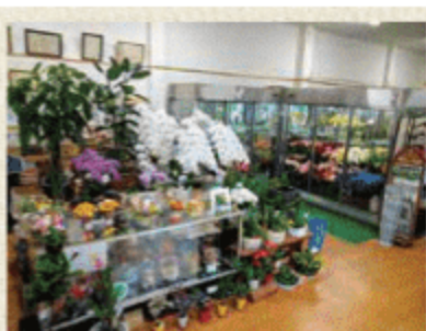
フラワーショップ いしばし

中津市下清水535 ☎0979-24-0387 【営】9:30～19:30 【休】火・1/1～1/3 8/14～8/16