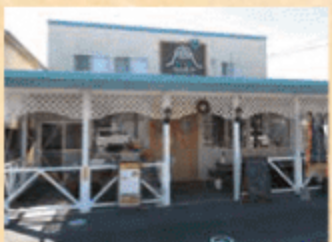
⑭近藤松月堂 [tree] sweets&Cafe 豊後高田市高田844 ☎0978-22-2364 [営]10:00～19:00 [休]水曜日