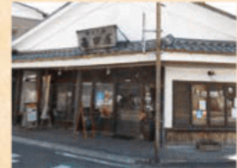
⑫菓子禅高田屋 豊後高田市金谷町633-1 ☎0978-22-3033 [営]9:30～18:00 [休]木曜日