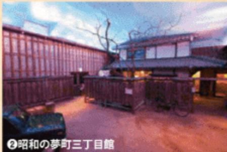
②昭和の夢町三丁目館

全長180mの巨大迷路で、昭和時代にタイムスリップ。開くドア開かないドアなど、仕掛けがいっぱい。