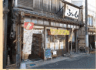
⑦吉焼き芋専門店 ふうくも 豊後高田市新町949-1 ☎0978-22-3117 [営]10:00～17:30 [休]火曜日