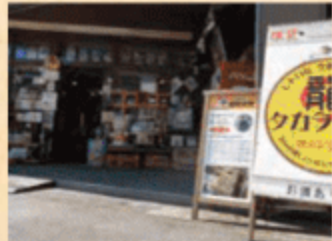
⑪龍のタカラバコ 豊後高田市新町976-1 ☎0978-22-3960 [営]10:00～18:00 [休]月曜日(祝日の場合は営業)