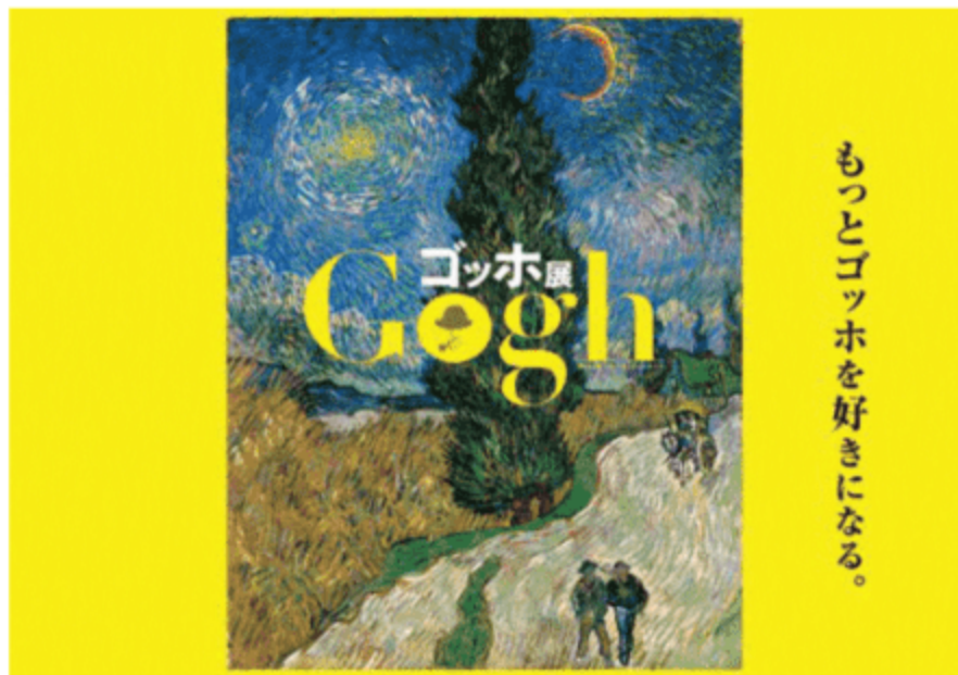
フィンセント・ファン・ゴッホ「夜のプロヴァンスの田舎道」1890年5月12-15日頃クレラー=ミュラー美術館 ©Kroller-Müller Museum, Otterlo, The Netherlands