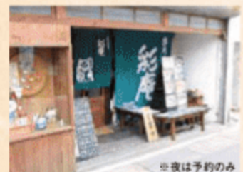
⑥串揚げ専門店 彩庵 豊後高田市新町948 ☎0978-24-0072 [営]平日:11:30～14:00 土日祝～15:00 [休]不定休