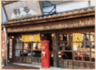
⑧二代目餅屋 清末/杵や 豊後高田市新町950 ☎0978-24-2402 [営]土日祝のみ 営業10:00～17:00