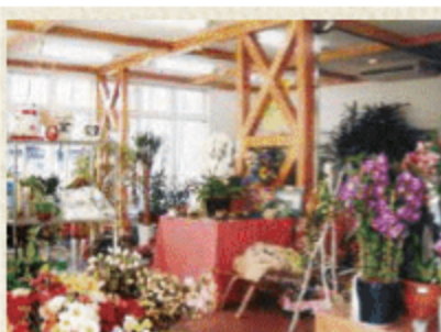
五所生花店 本店のみ

宇佐市石田58-1 ☎0978-32-0728 【営】9:00～18:00【休】1/1～1/3