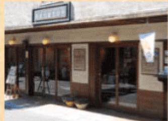
⑩ブラジル珈琲舎 豊後高田市新町971 ☎0978-24-3240 [営]10:00～17:00 [休]無休