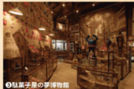
③駄菓子屋の夢博物館

チャイムの音が聴こえてきそうな教室や駄菓子屋・写真館など、昭和30年代の風景が広がっています。