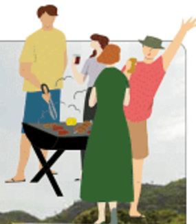
写真は4人分のイメージです