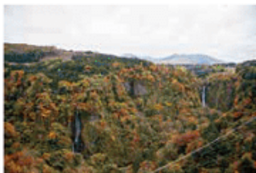
九重“夢”大吊橋からの風景

平成18年(2006)10月30日にオープンした、「九重“夢”大吊橋」。長さ390m、高さ173m、幅1.5mのこの橋は、歩道専用として「日本一の高さ」を誇る吊橋です。すぐ目前に、「日本の滝百選」にも選ばれた、「震動の滝・雄滝」や「雌滝」を望み、足下に筑後川の源流域を流れる鳴子川渓谷の原生林が広がり、四季折々に織りなす大自然の変化は訪れる人々を魅了してやみません。また遠くに、三俣山や涌釜山など雄大な「くじゅう連山」が横たわり、360度の大パノラマは、まさに「天空の散歩道」にふさわしい、文句なしの絶景です。